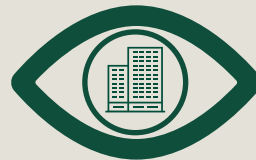
Innenausstattung Seite 8