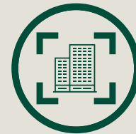
Objektauswahl/ Long- und Shortlist Seite 6