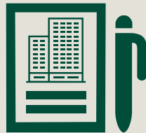
Strategieentwicklung Seite 5