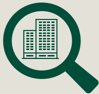
Grundlagenermittlung Seite 4

Wählen Sie mit uns gemeinsam die Leistungen, die Ihr Unternehmen in optimalen Räumen nach vorne bringen. Wir erläutern Ihnen gerne die Inhalte in einem persönlichen Gespräch.