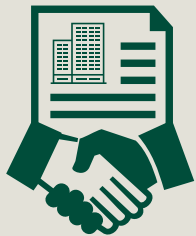
Vertragsverhandlung Seite 7